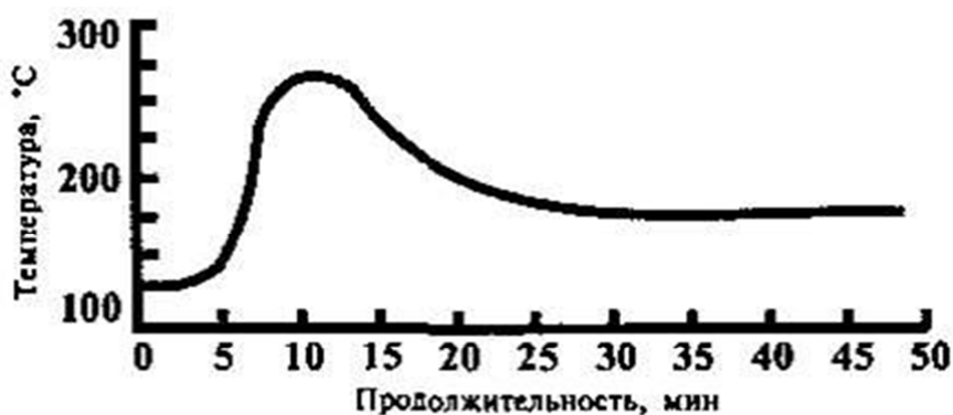
Рис. 71. График температурного режима в пекарной камере

Ответ: график температурного режима в печной камере относится к выпечке: